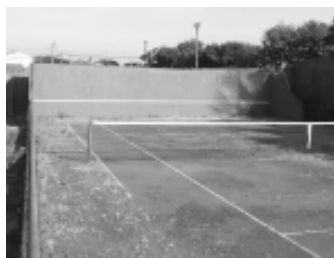
Quadra de tênis deve ser recuperada em breve

Estamos estudando uma parceria com a Secretaria Municipal de Esportes com o intuito de recuperar a quadra de tênis. Ainda em negociação, a parceria visa o uso da quadra em conjunto com a secretaria, a qual pretende ministrar aulas gratuitas do esporte em horários específicos, ficando os demais horários livres para uso dos associados.