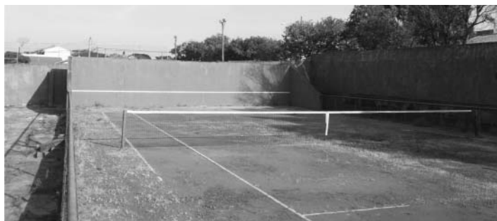
Em breve a quadra estará pronta para a prática do esporte

As regras de uso por associados e não associados estão sendo definidas.