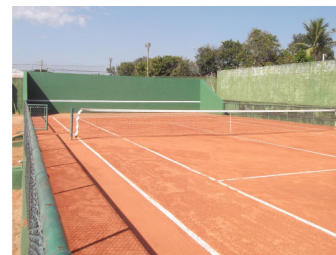
Quadra de tênis (saibro)

associados devem agendar o horário pelo fone/WhatsApp 99810-7919, e assinar um termo de responsabilidade pelo tempo em que estiver utilizando o local.